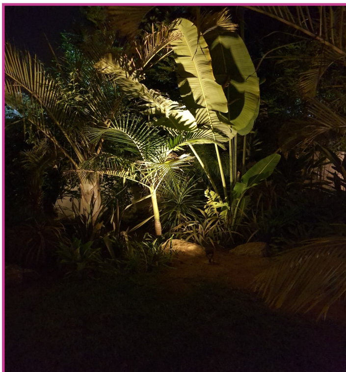
Données photométriques (2700K, 6W, 30°):